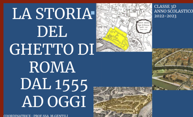
Classe III D "Il ghetto di Roma, storia e curiosità"