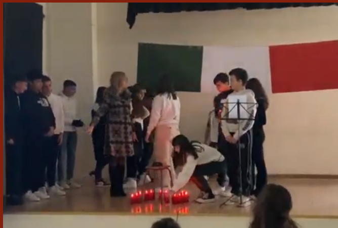
Classe III D presentazione e commemorazione, con introduzione della prof.ssa Gentili