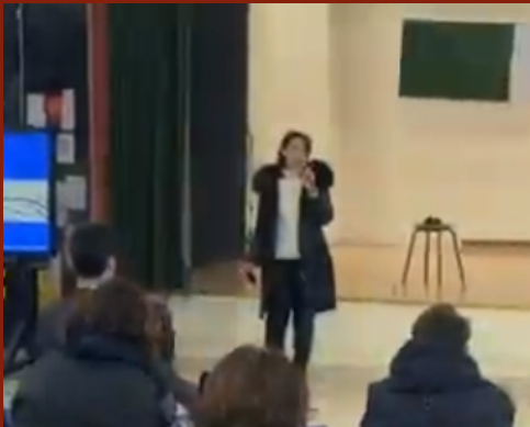
Introduzione della Dirigente scolastica