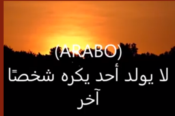
Messaggio di pace in lingue straniere