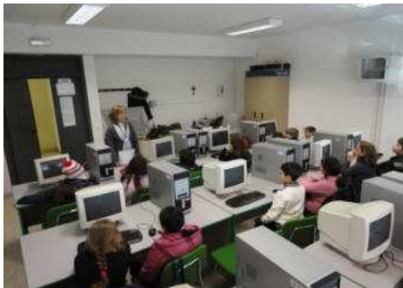
Laboratorio di informatica