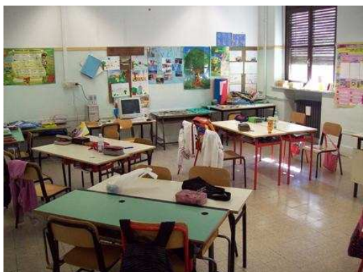
Aule e corridoi