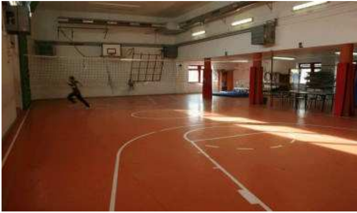
Palestra con parete da arrampicata